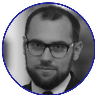
TOMÁŠ KOPEČNÝ náměstek pro řízení sekce průmyslové spolupráce Ministerstva obrany (MO ČR)